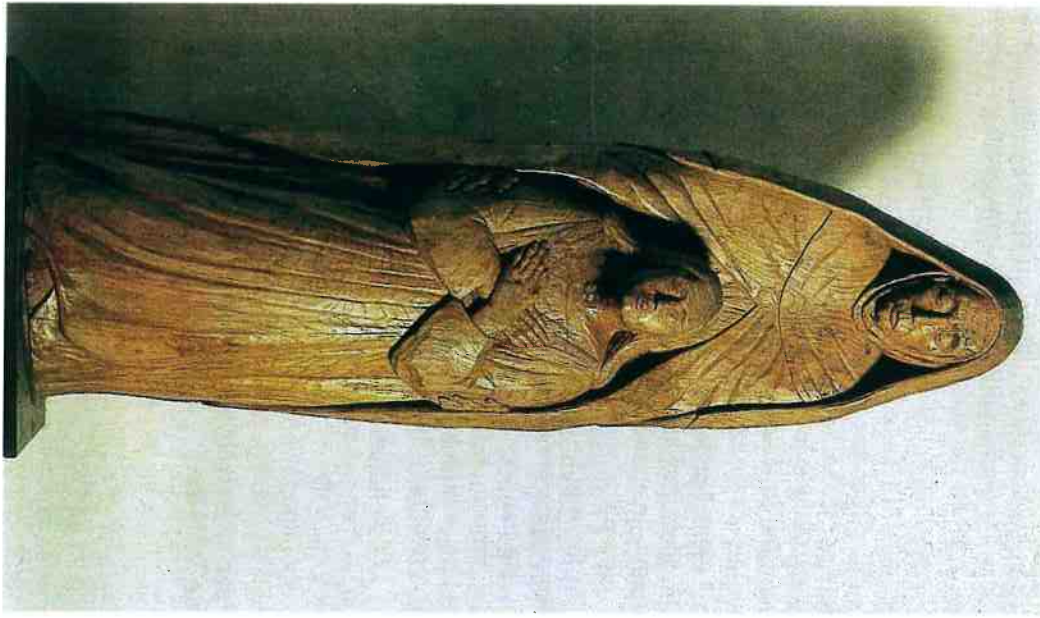
Statue de Sainte-Anne et Marie sculptée dans la masse par H. Hegeot, en 1932